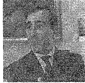
Il questore Damiano

Non servirà a cancellare né la condanna a cinque mesi e nemmeno quella revoca della carta di soggiorno che pende sulla testa anche dei loro genitori, ma per dimostrare che sono pronti non solo a chiedere scusa, ma che il loro comportamento è ben altro rispetto a quello dimostrato il pomeriggio del 20 maggio.